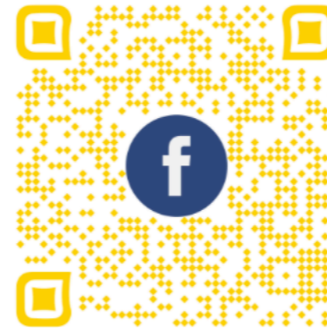
Notre page privée Facebook