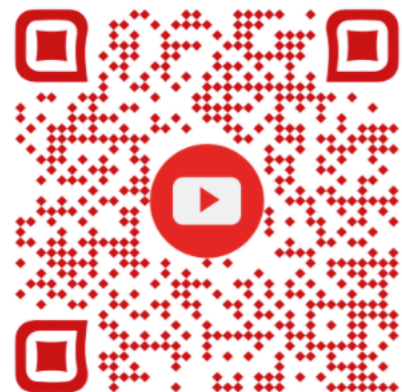
Notre chaîne Youtube