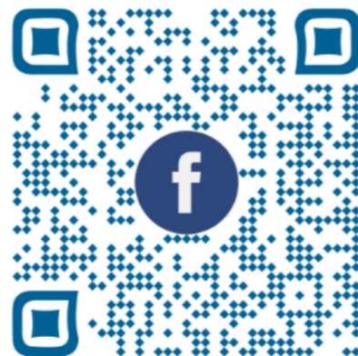
Notre page publique Facebook