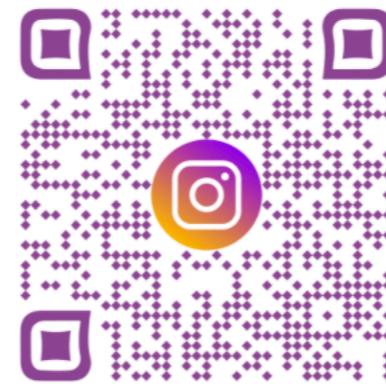
Notre compte INSTAGRAM