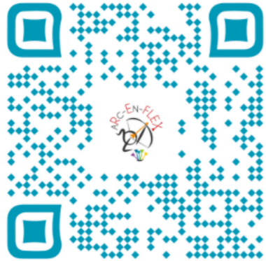
Notre site web

Retrouvez Arc-en-flex® et l'équipe sur les réseaux.